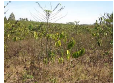
Rẫy cà phê bị bỏ hoang, cỏ mọc um tùm đang chờ ngày bị chặt

Nhiều rẫy cà phê hai bên đường để cỏ mọc um tùm, cà phê xơ xác, theo người dân thì những rẫy này sắp đốn nên không chăm nữa. Có người đốn để trồng lại cà phê con, cũng có người chuyển đổi cây trồng như anh Thăng (34 tuổi) ở Đắk Sắk lập hẳn trang trại trong rẫy cà phê. “Mình trồng rau, nuôi cá, chăn nuôi - anh Thăng cho biết - tính ra chi phí đầu tư thì hơn trồng cà phê vì rau là cây ngắn ngày, mỗi vụ với 3 sào đất có thể thu về 7-10 triệu đồng”.