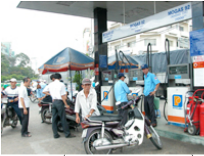
Ngày sau Tết giá xăng đã tăng thêm gần 600 đồng/lít

Theo tin từ Tổng công ty Xăng dầu Việt Nam (Petrolimex) kể từ 12 giờ trưa nay (21.2) giá xăng sẽ được điều chỉnh tăng thêm 590 đồng/lít; giá các mặt hàng dầu vẫn giữ nguyên.