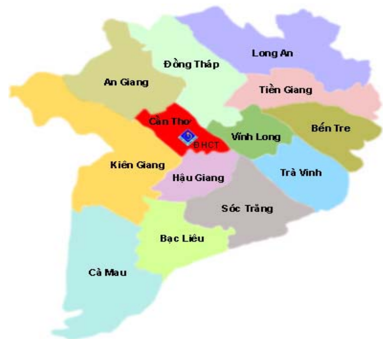
Bản đồ Đồng Bằng Sông Cửu Long

Tính đến nay, hầu hết các tỉnh phía Nam đã bắt tay vào kế hoạch xuống giống lúa hè thu. Hiện tỉnh Quảng Ngãi đang chỉ đạo bà con tập trung gieo sạ 27.745 ha lúa hè thu, dự kiến năng suất đạt trên 55 tạ/ha. Tranh thủ thời tiết thuận lợi, có mưa đều trên diện rộng, tỉnh Tiền Giang đã tập trung xuống giống vụ hè thu chính vụ với 72.630 ha, phấn đấu chăm sóc tốt để đạt năng suất bình quân 43,8 tạ/ha và sản lượng 317.766 tấn lúa hàng hóa. Cùng thời điểm này, thành phố Cần Thơ đã cơ bản hoàn thành kế hoạch xuống giống hơn 84.000 lúa hè thu, trong đó có 75.000 ha (89,2%) được sử dụng lúa giống chất lượng cao, đạt chuẩn xuất khẩu. Các tỉnh phía Nam đang cố gắng hoàn tất kế hoạch xuống giống lúa hè thu vào cuối tháng 6/2007.